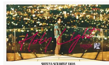
<エントリーチケット>